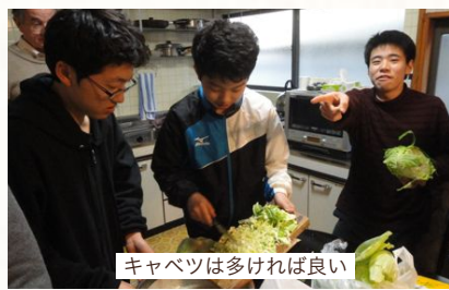
キャベツは多ければ良い