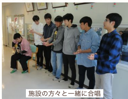
施設の方々と一緒に合唱