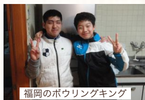
福岡のボウリングキング