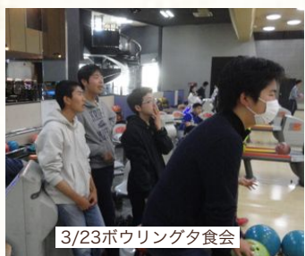
3/23ボウリング夕食会