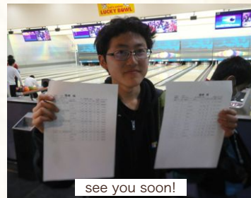
see you soon!